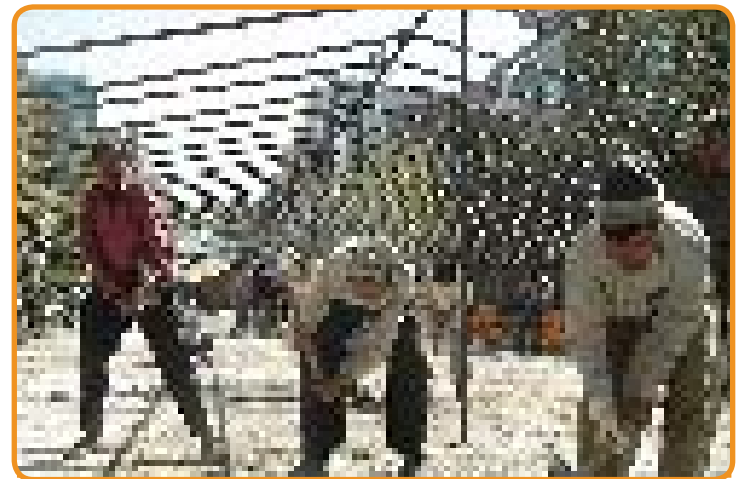
حضور مهاجران افغان در شهرستان ورامین زمینه بروز بسیاری از آسیبها را فراهم کرده است

در شش ماهه دوم سال ۸۷، ۵۰۰ نفر از معلولان افغانی شناسایی و از خدماتی همچون آموزش در خانواده، ارجاع به متخصصین و تأمین امکانات درمانی و دارو بهره مند شدند