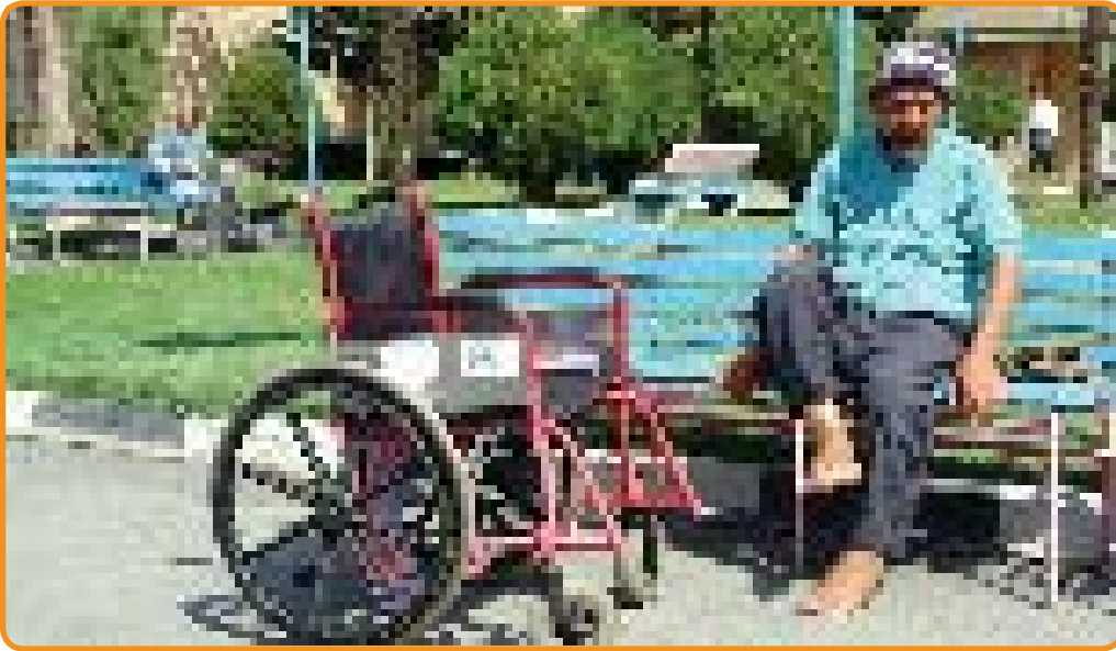
معاون امور توانبخشی بهزیستی استان تهران: